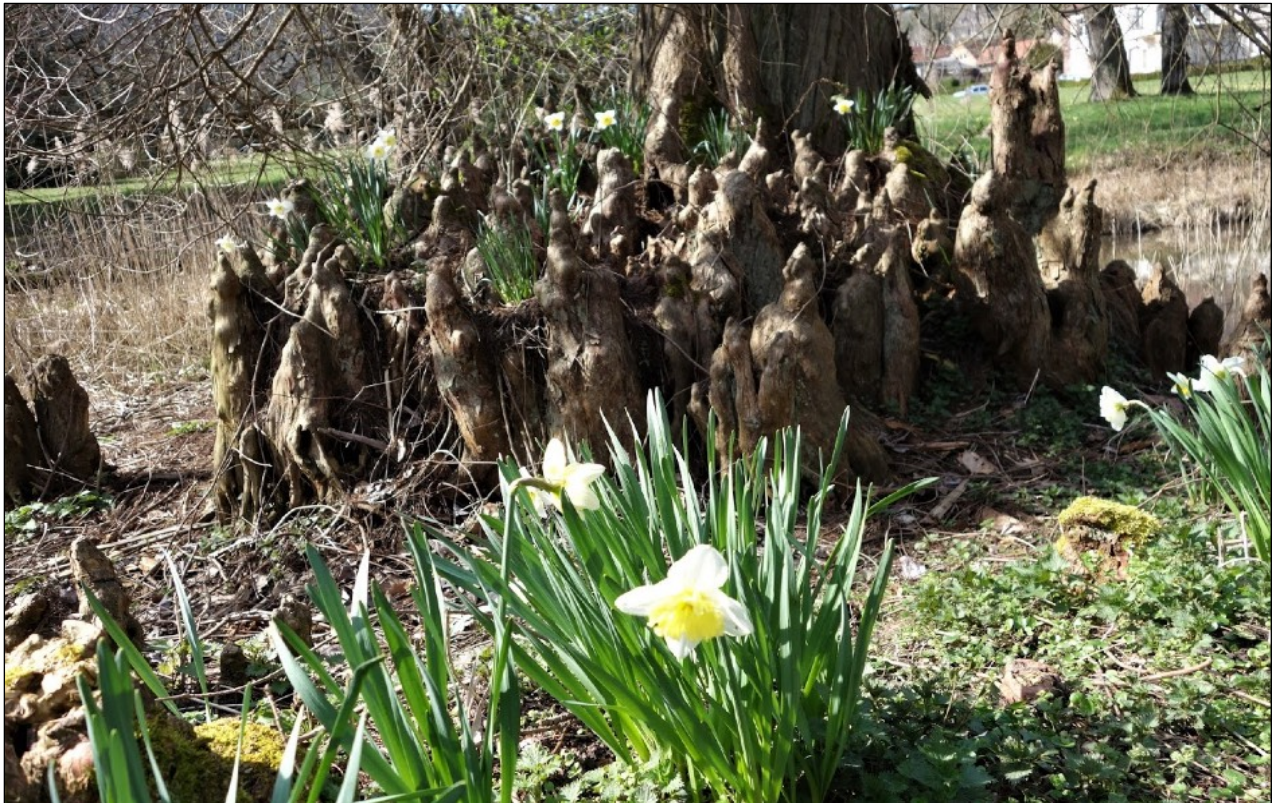
Le cyprès chauve, l'arbre aux racines aériennes appelées: pneumatophores.