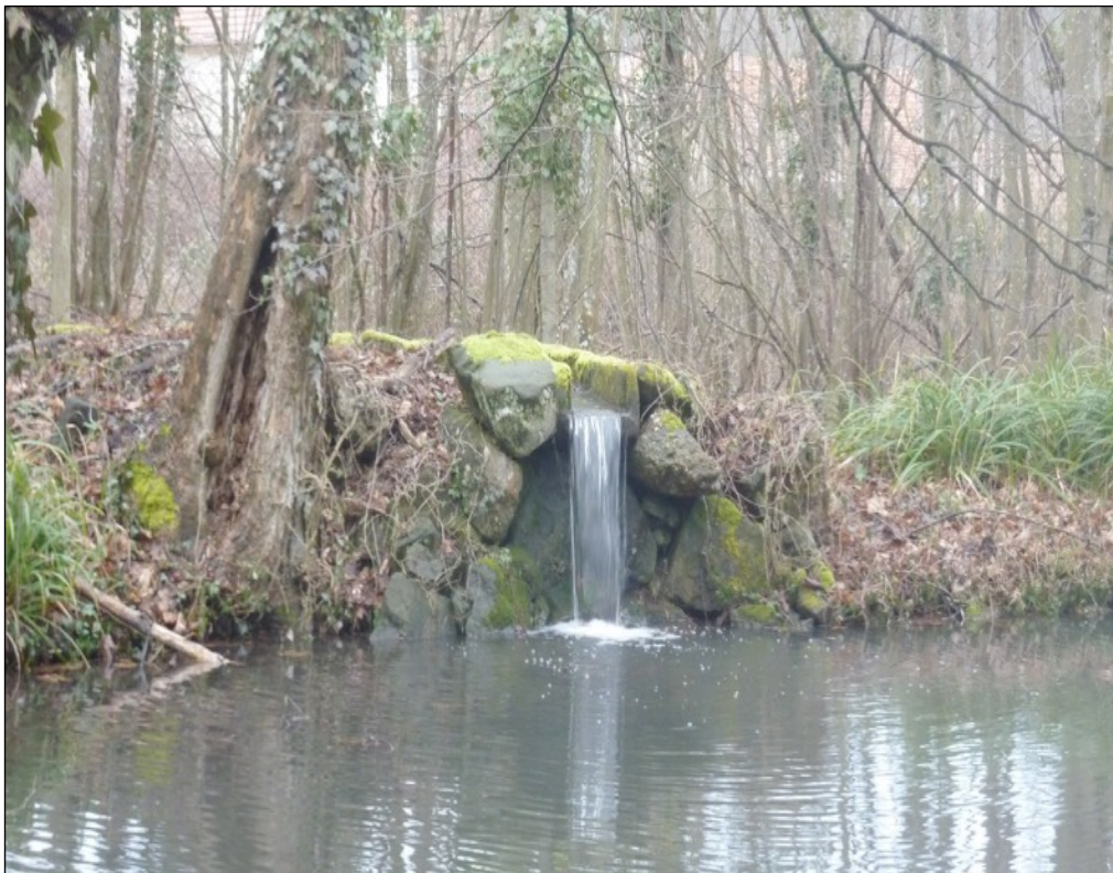
La relève est assurée!