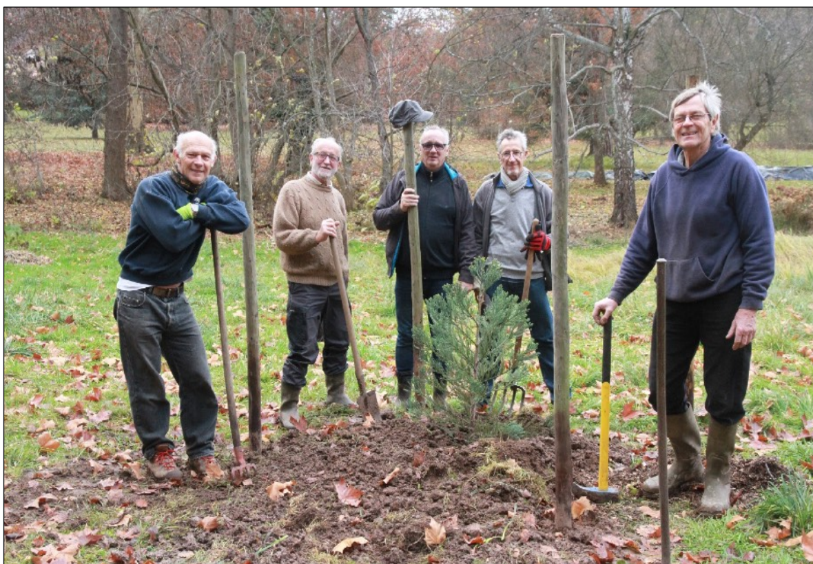
Une des nombreuses plantations: petit séquoia deviendra grand!