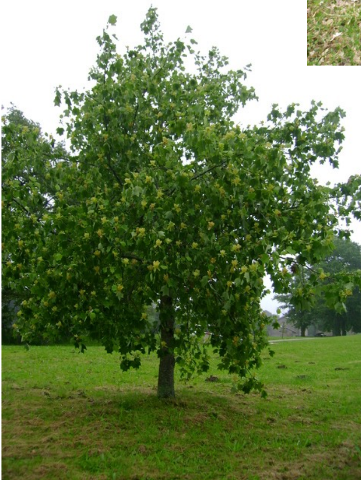
Tulipier en fleurs.