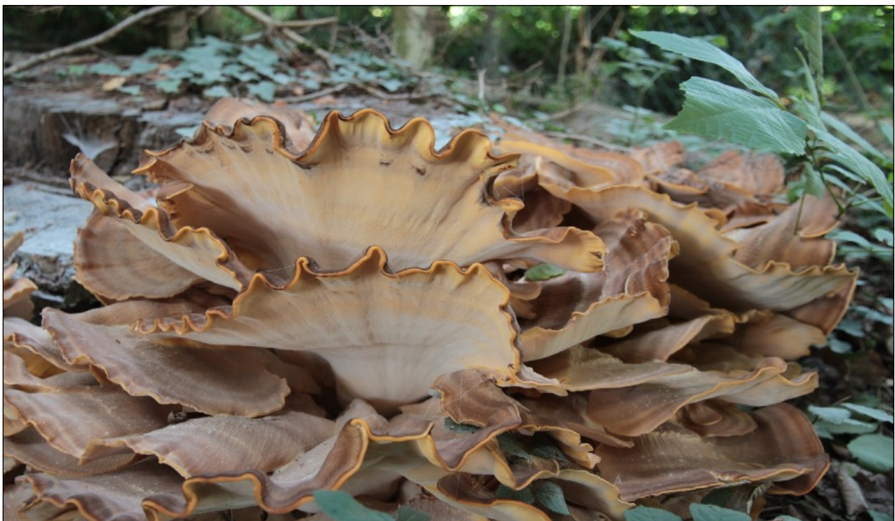
Polypore géant ayant poussé sur une souche de hêtre en automne 2020.